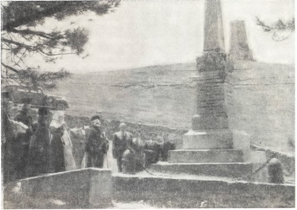
МИТРОПОЛИТ НИКОЛАЙ СОВЕРШАЕТ ПАНИХИДУ НА ШИПКЕ У ПАМЯТНИКА РУССКИМ ВОИНАМ (1877—1878 гг.)

клады, которые он произносил при разных случаях во время своего короткого пребывания. Он произвел сильное впечатление своей любвеобильностью и отзывчивостью славянского сердца, своей большой культурой и эрудицией, а также и своим прекрасным ораторским даром. Он поистине является оратором большого стиля и искренним борцом за мир и правду на свете. Его речи производят неотразимое впечатление на всех, кто их слушает».